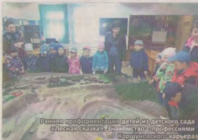
Ранняя профориентация детей из детского сада «Лесная сказка», знакомство с профессиями Коршунковского карьера

В ЭТОМ УЧЕБНОМ ГОДУ 186 СТУДЕНТОВ ПРОФЕССИОНАЛЬНОГО КОЛЛЕДЖА ПРОШЛИ ПРОИЗВОДСТВЕННУЮ ПРАКТИКУ В КОРШУНОВСКОМ ГОКЕ